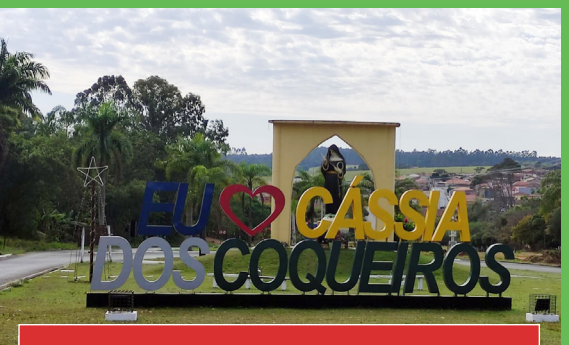
Portal de Santa Rita de Cássia