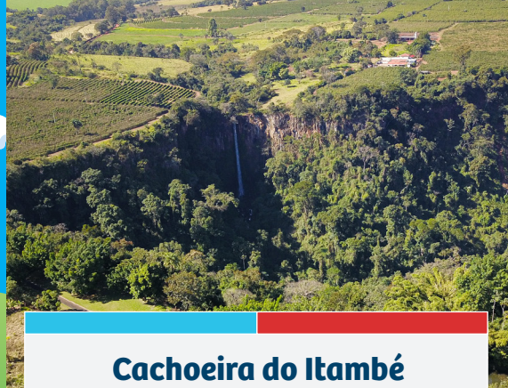
Cachoeira do Itambé