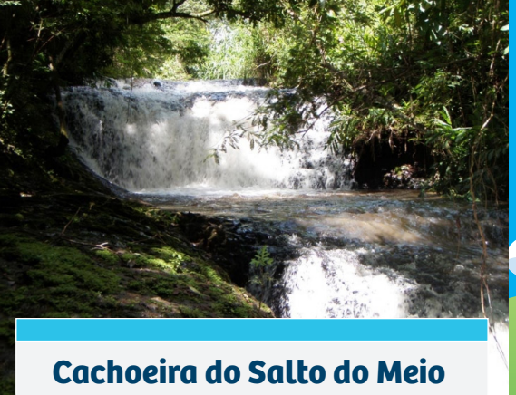
Cachoeira do Salto do Meio