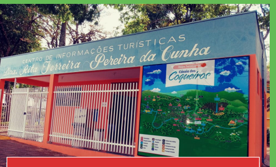
Centro de Informações Turísticas e Mapa da Cidade