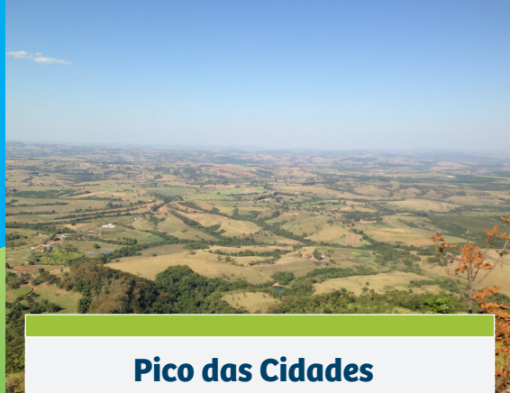
Pico das Cidades