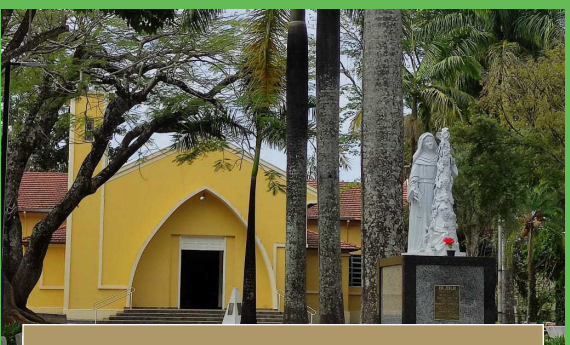
Paróquia Santa Rita de Cássia