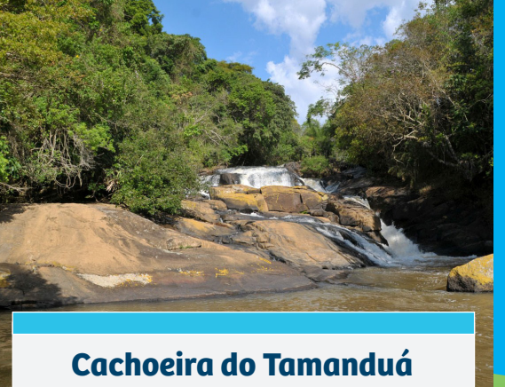
Cachoeira do Tamanduá