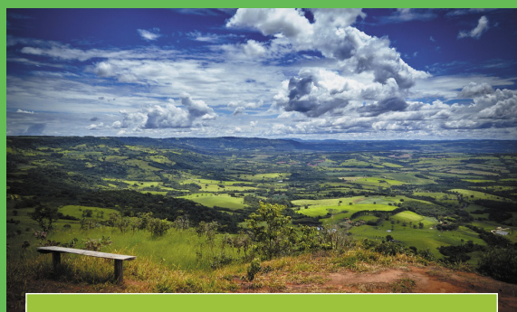
Mirante da Serra