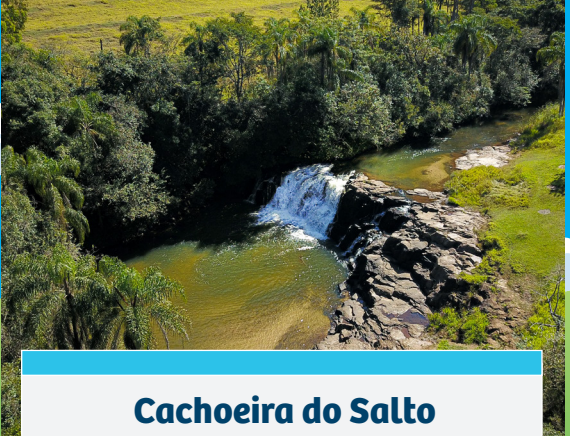
Cachoeira do Salto