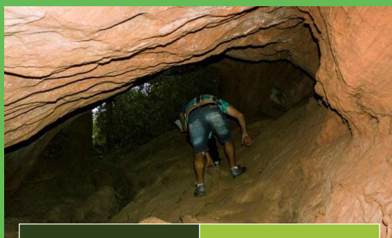
Gruta Toca da Onça