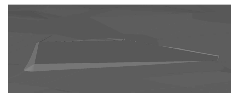
PERSPECTIVAS DO PATAMAR A SER IMPLANTADO